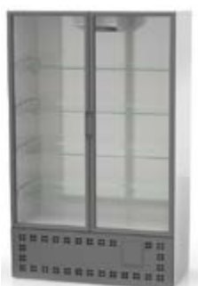
Meubles de vente à groupe logé