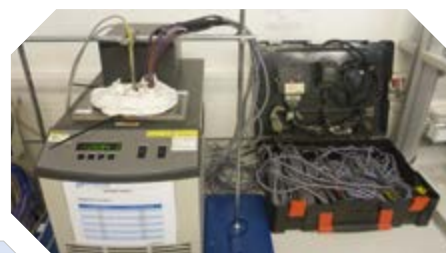
Enregistreurs de température